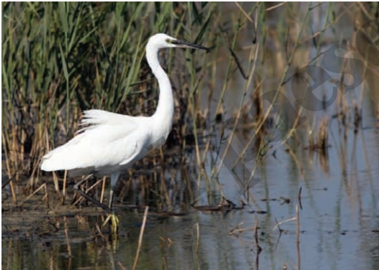
(In alto) - Garzetta bianca (In basso) - La spatola, simbolo del Lago