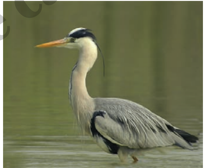
(In alto) - Airone cenerino (In basso) - Falco pescatore