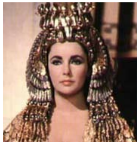
Elizabeth Taylor, indimenticabile interprete del film Cleopatra

dabile attrice che in questo film riesce a dare il meglio del suo talento recitativo. Da non perdere assolutamente. Ma anche in questo caso, quest'opera non è inclusa nel catalogo italiano dei DVD di entrambi gli attori, mentre è diffusissima in America e in Europa, dove si possono acquistare solo in lingua originale, non doppiata nella versione in italiano.