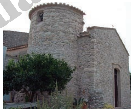
Chiesa della Madonna della Marina

Costruita nella frazione San Nicola, nello stesso punto in cui sorgeva l'antica chiesa danneggiata dal terremoto del 1908 e poi demolita. Il portale è in pietra lavorata.