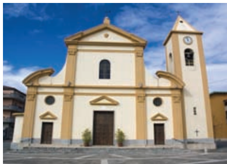
Chiesa di S. Maria del Pozzo in piazza Concordia ad Ardore Marina

Di semplice architettura con portale sormontato da un timpano.