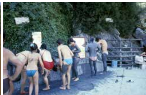
Grotta delle Ninfe. Bagnanti cosparsi di fanghi sulfurei estrati dalle acque della grotta.