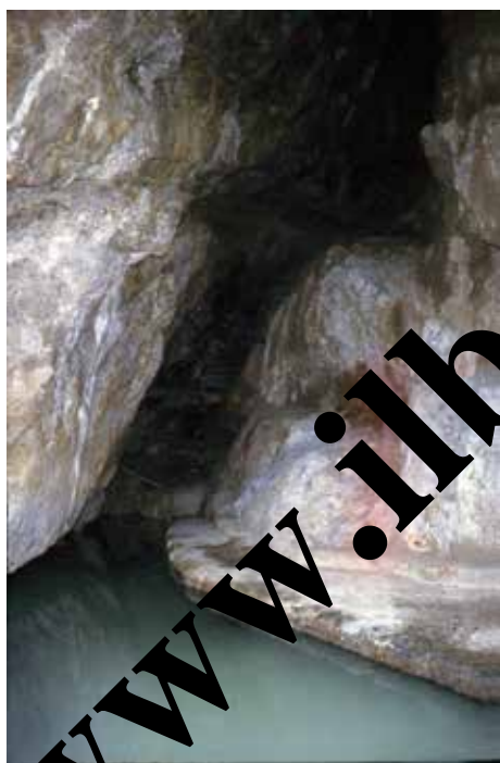
Grotta delle Ninfe.